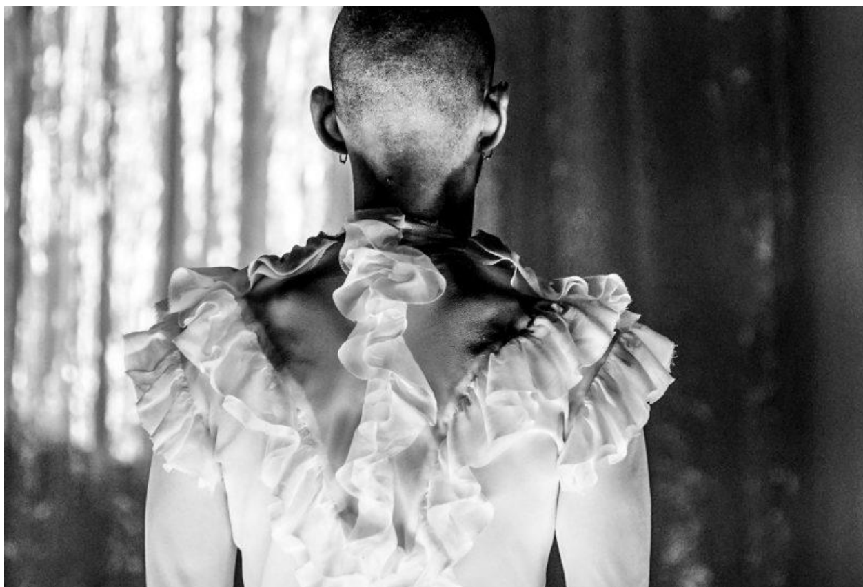
La rassegna romana "Sotto l'angelo del Castello" si apre con "WE, the Angel" di Emio Greco e Pieter C. Scholten

Dall'isola alla Capitale . In uno dei suoi luoghi monumentali più iconici e affascinanti della città: Castel Sant'Angelo dove dal 29 giugno parte la terza edizione di una rassegna di danza con musica e spettacolo. Il progetto " Sotto l'Angelo di Castello " è curato e organizzato, nell'ambito delle attività della Direzione Musei statali della città di Roma, da Anna Selvi. La rassegna si apre il 29 giugno con " WE, the Angel ", un viaggio di danza ad hoc per Castel Sant'Angelo inventato da Emio Greco e Pieter C. Scholten , autori di produzioni di danza e fondatori nel 2009 della ICK Dans Amsterdam . La performance si concentra in particolare sull' Angelus Novus : "l'immagine creata da Paul Klee che, nell'interpretazione del filosofo Walter Benjamin , affronta il passato. Le sue ali spiegate catturano il vento dal paradiso e la tempesta in aumento spinge l'Angelo in avanti, in un'avventura incerta. Ecco: ritorno al futuro. Dispieghiamo le ali. La tempesta si alza". Il lavoro sarà dislocato negli spazi di Castel Sant'Angelo , con 9 performer, di cui 7 ballerini e 2 percussionisti (tre repliche al giorno: 29 giugno ore 18.30 – 19.30 – 20.30; 30 giugno e 1 luglio ore 19.30 – 20.30 – 21.30). Spettacolo itinerante per 30 spettatori a recita.