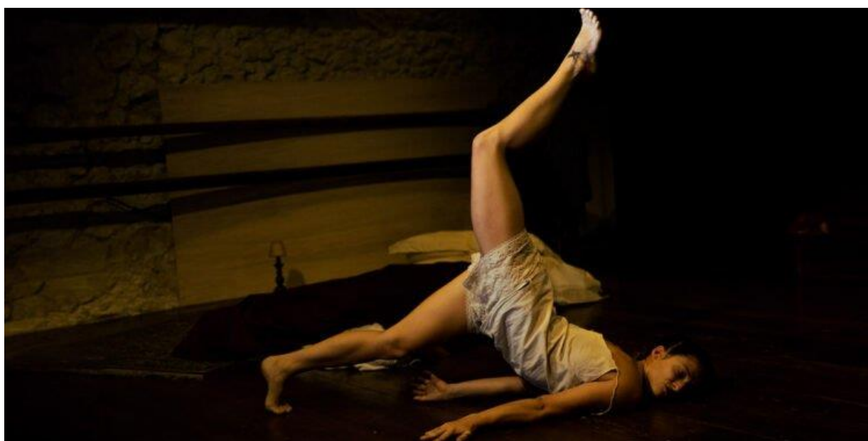
"Racconti dell'illusione" della Compagnia Oltrenotte

Il 14 settembre nuovo appuntamento della XVI edizione di Logos Cortoindanza , la rassegna tra danza, arte performativa, arte circense, teatro e musica, diretta da Simonetta Pusceddu che ospita